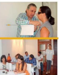
kendine sağlan bir yer edinmek" gibi motivasyonları işlediğini söylüyor.